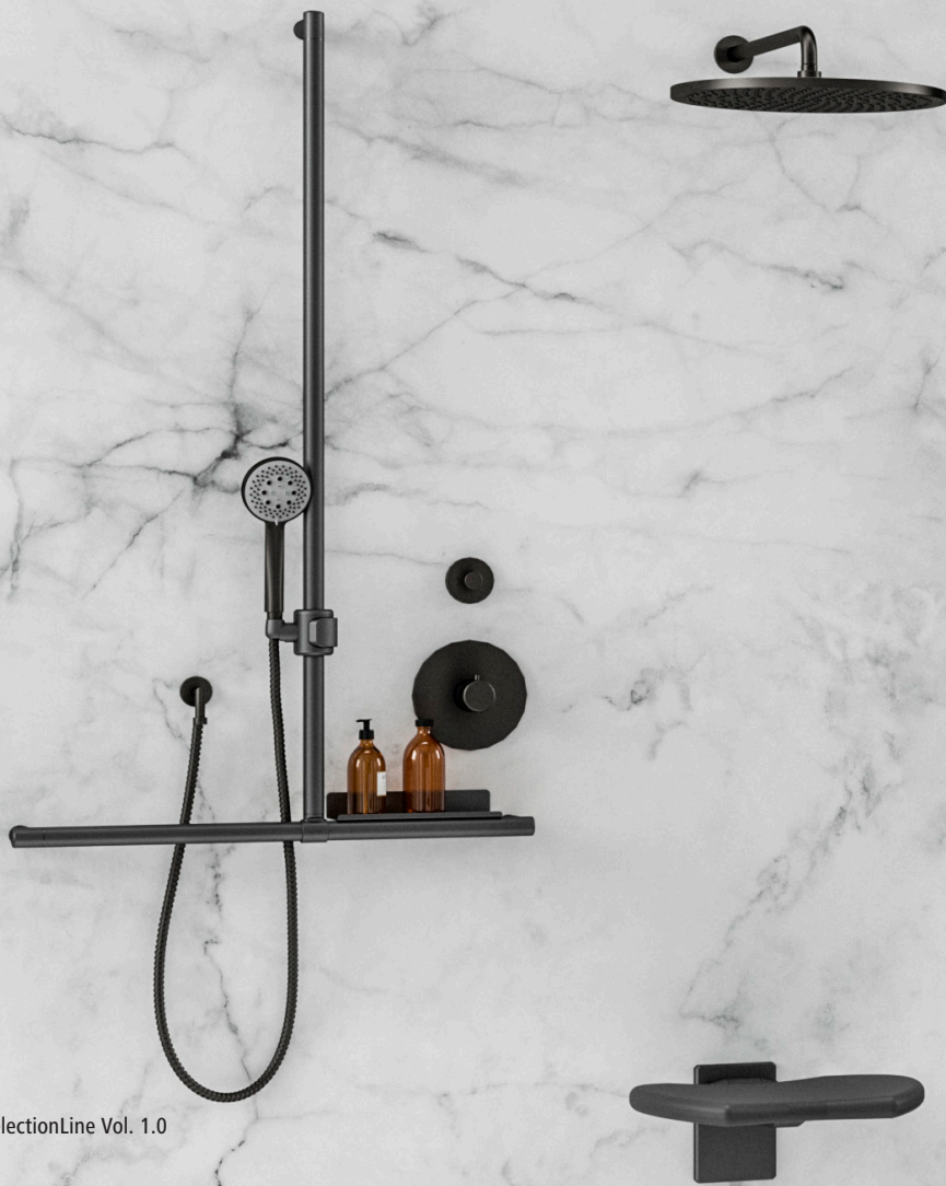
SelectionLine Vol. 1.0